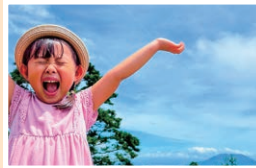
『桜島がキレイに見えるよ』