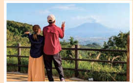
『アラフォーカップル』