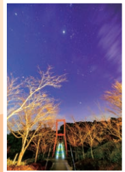
『冬の星空に魅了されて』